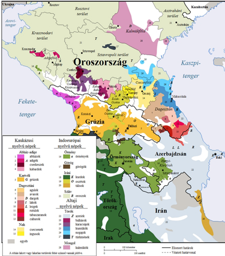
A dél-kaukázusi térség etnikai-nyelvi összetétele