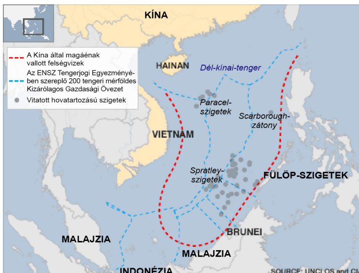
A Dél-kínai-tenger vitatott hovatartozású szigetcsoportjai

A Dél-kínai-tengeren található szigetek feletti szuverenitás gyakorlása hosszú évtizedek óta feszültségforrás a térség országai között. A Spratly, kínai nevén Nansa (Nansha), valamint a Parcel, kínai nevén Hszisa (Xisha) az a két szigetcsoport, amely leginkább a nemzetközi közvélemény figyelmébe szokott kerülni a térség szigetvitáinak kiéleződése kapcsán. Kína és Vietnam mindkét szigetcsoportra igényt tart, míg a Spratly-szigetek egyes részeire az előbbi két ország mellett a Fülöp-szigetek, Malajzia és Brunei is igényt formál. A jelenleg főként kínai ellenőrzés alatt álló szigetek azért kulcsfontosságúak, mivel az ENSZ tengerjogi szabályozása alapján a terület birtokosa igényt formálhat a partoktól 200 tengeri mérföldig terjedő tengerszakaszokra, ami lehetővé teszi szinte a teljes Dél-kínai tenger feletti területi ellenőrzést.