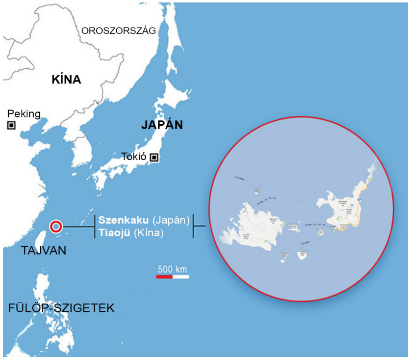
A Szenkaku-/Diaoyu-szigetek elhelyezkedése

van annak, hogy ki gyakorolhat felügyeletet a szigetek körüli vizek felett. Japán szintén érdekelt a terület megtartásában, hogy létrehozassa és megtarthassa a nemzetközi tengerjog által biztosított, 200 tengeri mérföldre nyúló kizárólagos gazdasági övezetét a Kelet-kínai-tengeren.