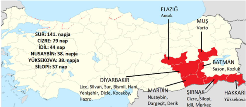
A leghosszabb, megszakítás nélküli kijárási tilalmak