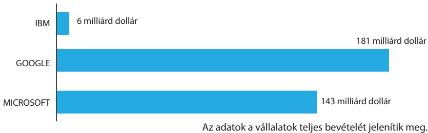
2. ábra: Az USA technológiai vállalatainak bevételei, 2020

elsődleges projektje az internetes infrastruktúra és az információkhoz történő hozzájárulás lehetőségének fejlesztése ezekben a jelenlegi helyzetükben digitálisan elmaradott országokban. Kezdeményezéseket indított továbbá a térségben a digitális oktatás támogatásáért, szoftverei felhasználószámát a fejlődő térség lakosságával kívánja bővíteni. A harmadik globális technológiai vállalat, amely határozott jelenléttel rendelkezik a térségben, az IBM, amely számos területen aktív, beleértve a számítógépek gyártását, az informatikai szolgáltatásokat és a technológiai eszközök üzleti alkalmazásának területét is.